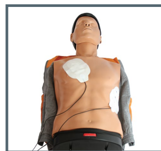
Posizionamento elettrodi DAE