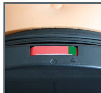
Indicatore di compressione