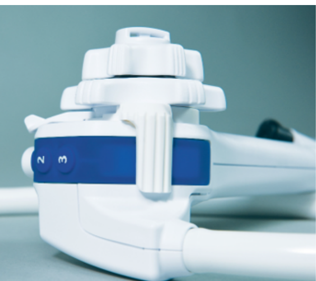
Leva per controllare il movimento dell'elevatore