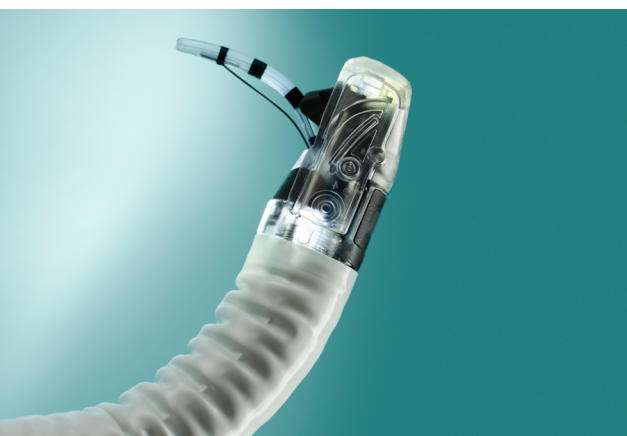
Elevatore in uso con sfinterotomo sulla punta distale

Con aScope™ Duodeno, hai un endoscopio nuovo per ogni paziente, garantendoti una performance costante, senza rischio di contaminazione crociata. Inoltre, non necessita di reprocessing o riparazioni costose.